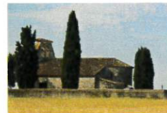
St Julien de la Serre