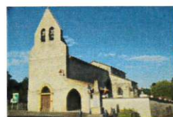
St Amans de Tayrac