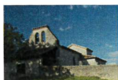
St Louis de Gandaille