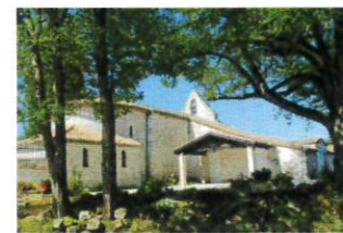
St Pierre es liens de Grayssas