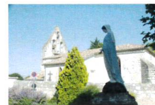
ND de Perville

Kartendaten: © OpenStreetMap-Mitwirkende, SRTM | Kartendarstellung: © OpenTopoMap (CC-BY-SA)