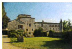
Moulin de Ferrussac