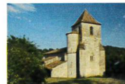
St Martin d'Anglars