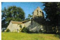
ND de Ferrussac