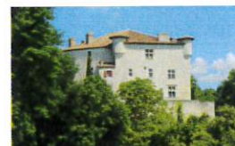
Château de Combebonnet