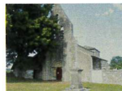
St Pierre del Pech