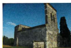
St Pierre de Cambot