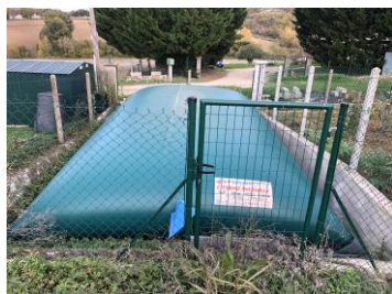
Photo ci-contre, le PEI installé route des tulipes.

Les travaux de mise en place de ces PEI sont soldés sur la totalité du territoire. Un investissement conséquent mais nécessaire afin de compléter la capacité de lutte contre l'incendie de toutes les habitations. Avec St Julien, la route des tulipes, la Prade et Fraysses, le bouclage est terminé.