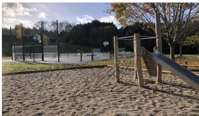
Eglise St Julien

Un endroit ludique tout près du lac où vous pourrez pique-niquer avec vos enfants tout en jouant à la pétanque.