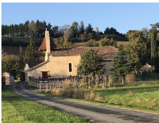
La rue de la Rause

Une rénovation magnifique avec en bonus l'enfouissement des réseaux